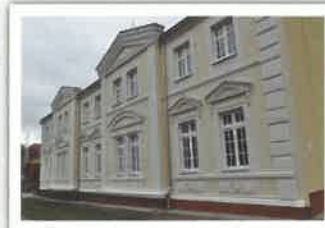
Budynek Ośrodka Kultury w Mirosławcu przed i po modernizacji.