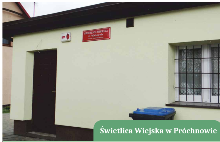
Świetlica Wiejska w Próchnowie

W lipcu planowane jest uruchomienie procedury związanej z wyłonieniem wykonawcy robót w ramach zadania pn. „Przebudowa ul. Sprzymierzonych w Mirosławcu wraz z odwodnieniem (od ul. Wileńskiej do ul. Wolności)”. Wykonawca będzie wybierany w ramach przetargu nieograniczonego.