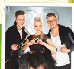
PIĘKNI I MŁODZI